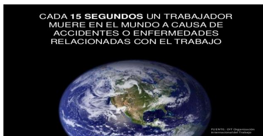
Imagen tomada de:

Apreciado aprendiz, el objetivo de esta guía es generar una cultura de auto cuidado, auto respeto y responsabilidad, a través de hábitos de vida saludable en el entorno laboral, identificando y reportando los factores de riesgo ocupacionales presentes en su ambiente de trabajo y disminuyendo los índices de ausentismo por Accidente o Enfermedad de tipo Laboral. El análisis de conceptos, las herramientas creadas para identificación y control de riesgos, así como el estudio de casos reales, le permitirán cumplir con el objetivo de la guía.